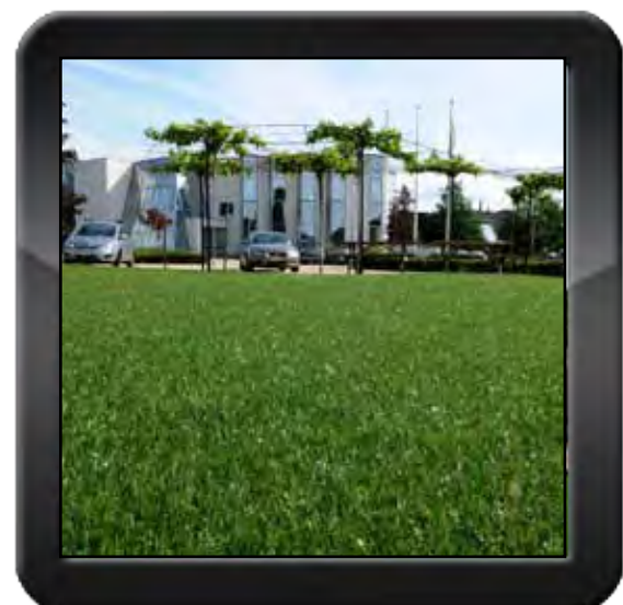
6. afgewerkt resultaat