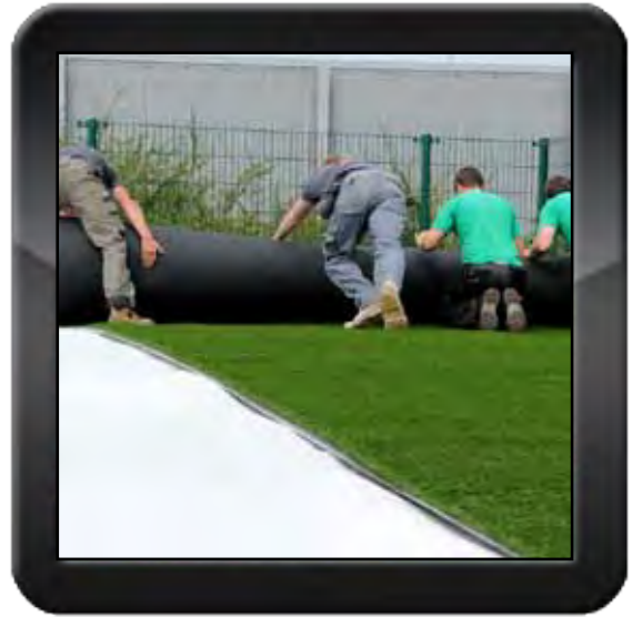
2. uitrollen kunstgras